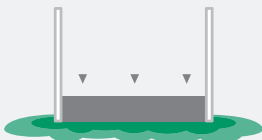
Dalle de soubassement