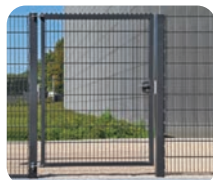
Draaiport met staafmatvulling