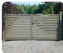
Alzebra 120 poort