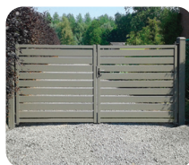
Portail Alzebra 120