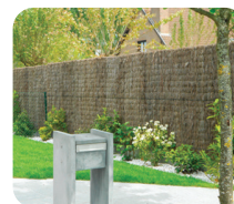
Occultation Natte de Bruyère