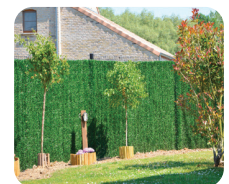
Occultation Canada Super