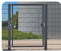
Portillon Treillis soudé