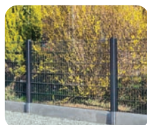
Clôture Vision Open