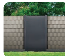
Module Tôle Perforée